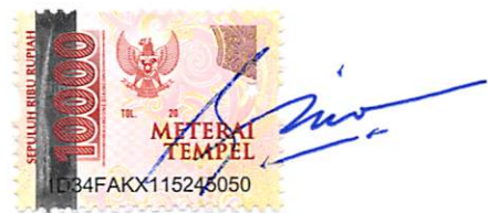
RINO WISNU PUTRO PLT DIREKTUR KOMERSIAL DAN PENGEMBANGAN USAHA