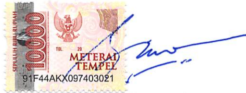
RINO WISNU PUTRO DIREKTUR UTAMA