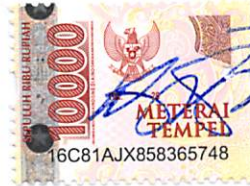
OGI RULINO KOMISARIS UTAMA